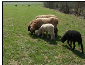
• Vom Schaf