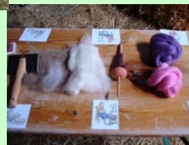
• zur Wolle

Unsere Programme sind Halbtags- Ganztags- oder Mehrtagesangebote für viele Gruppen wie