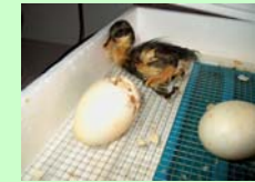
Vom Huhn zum Ei