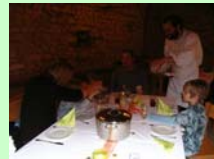
• Von der Milch zum Käse