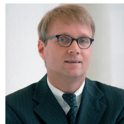
CDU-Generalsekretär Ronald Pofalla, am 26. Juni 2008

„Wir sind der festen Überzeugung, dass wir eine Laufzeitverlängerung ... der deutschen Kernkraftwerke benötigen, um sichere Energiepreise sicherzustellen.“