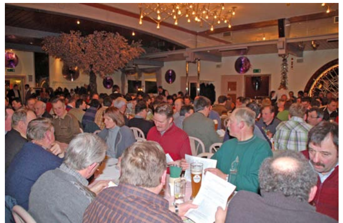
Beim Infoabend am 6. Februar im Gasthof Sammüller

Mittlerweile ist gentechnikfreier Soja auch im Landkreis Neumarkt erhältlich. Es geht also doch!