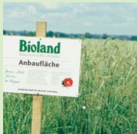
Bio-Landwirte verzichten auf 100 Prozent der Betriebsfläche auf chemischen Pflanzenschutz. Die typische Artenvielfalt über und unter dem Boden kann so weitgehend erhalten oder sogar regeneriert werden.