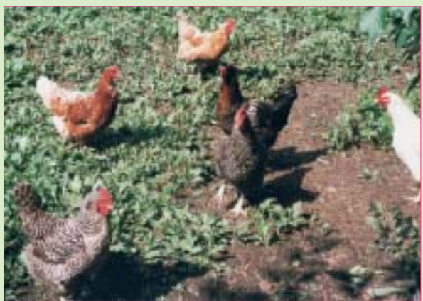
Auf dem Wagner-Hof in Puttenham dürfen die Hühner noch nach Herzenslust scharren. Ganz nebenbei entsteht so die charakteristische Pflanzengesellschaft der Geflügelhöfe.