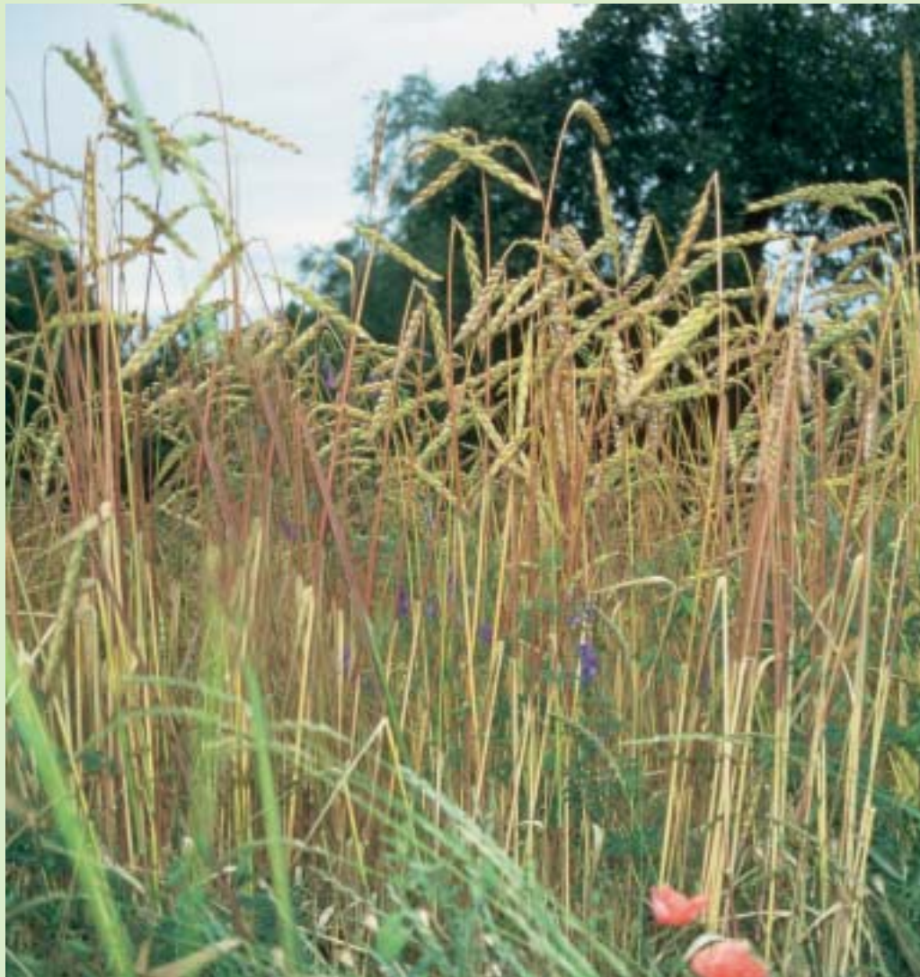
Rotkorn-Dinkel – eine alte und seltene Getreidesorte, die auf dem Hof der Familie Heindl (Lkr. Mühldorf) wie selbstverständlich zur Fruchtfolge gehört.

Weitere Pluspunkte wurden für eine möglichst artgerechte Tierhaltung wie Mutterkuhhaltung mit Weidebetrieb (ersatzweise Laufstall), Freilandhaltung von Schweinen und Hühnern und den Verzicht auf Futtermittelzukauf vergeben.