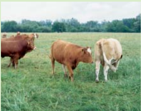
Limousin-Bullen und bayerische Fleckviehkühe sind der Grundstock für die Mutterkuhherde der Familie Kratzer (Lkr. Freising). Ihr Futter besteht in der Hauptsache aus Gras und Heu von den Freisinger Mooswiesen, die durch angepasste Mahd und schonende Beweidung langfristig erhalten werden.