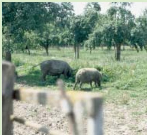
Alte Landrassen wie das schwäbisch-hallische Schwein auf dem Betrieb Ostner bei Marklkofen sind widerstandsfähig und kommen mit dem betriebseigenen Futter bestens zurecht. Riskante Futtermittelzukaufe werden so vermieden.