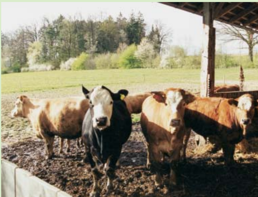
Der Offen-Laufstall mit Stroheinstreu und freiem Weidegang zu jeder Jahreszeit garantiert artgerechte Haltung und Tiergesundheit.