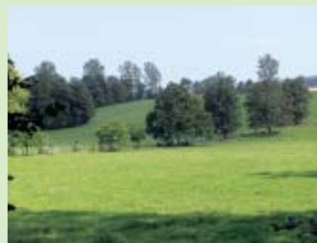
Mit Baumhagen eingefriedete Weidelandschaft bei Eurasburg (Lkr. Aichach). Lücken im Baumbestand werden Zug um Zug durch Jungbäume ersetzt.