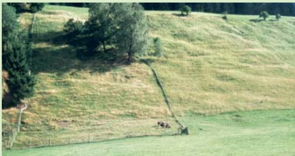
Die weit fortgeschrittene Planierung und Intensivierung der Talbuckelwiesen macht die letzten Vorkommen im Almbereich umso bedeutender: Extensiv genutzte Bergweiden und teilweise „händisch“ gemähte Buckelwiesen bei Oberaudorf.