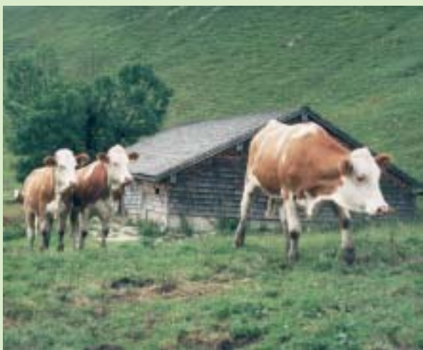
Jungvieh auf der Steinmüller-Alm bei Oberaudorf. Im Hintergrund stark reliefierte Lichtweiden.