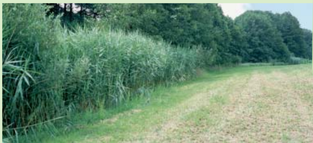
Ein breiter Schilfstreifen schirmt den dahinterliegenden Quellhang bei Dorfen (Lkr. Erding) vor Stoffeinträgen und Störungen ab.