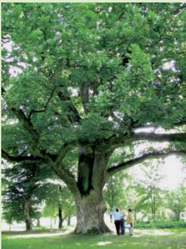
Freistehende Eiche als „Flurwächter“ bei Puttenham (Lkr. Rosenheim). Obwohl die Zahl der Bäume durch Pflanzungen bei uns heute wieder zunimmt, verschwinden noch immer landschaftsprägende Einzelbäume, weil sie mit modernen Landmaschinen, neuen Fluraufteilungen und dem Straßen- und Wegeausbau kollidieren.