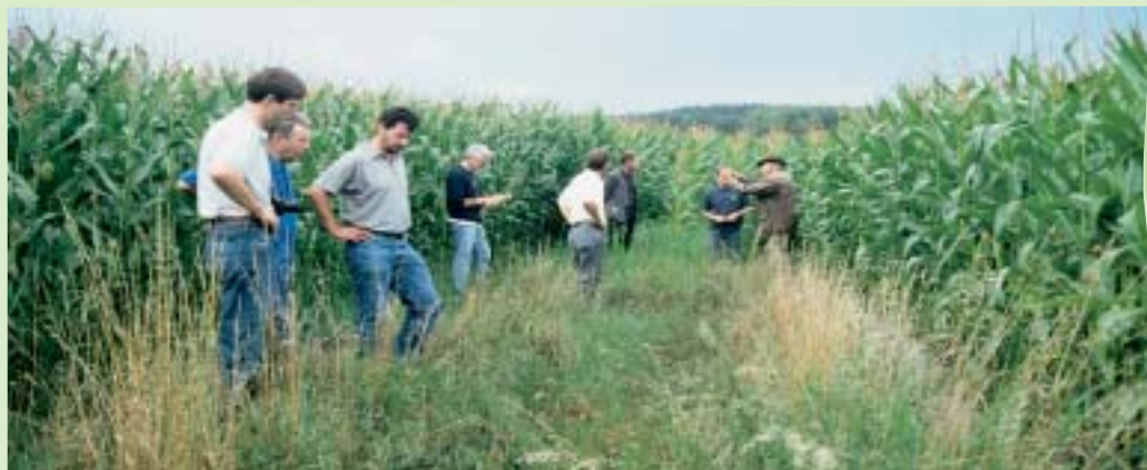
Visite im Maisacker: Wohlwollend begutachtet die Amberger Jury das kleine vom Landwirt respektierte Biotop.