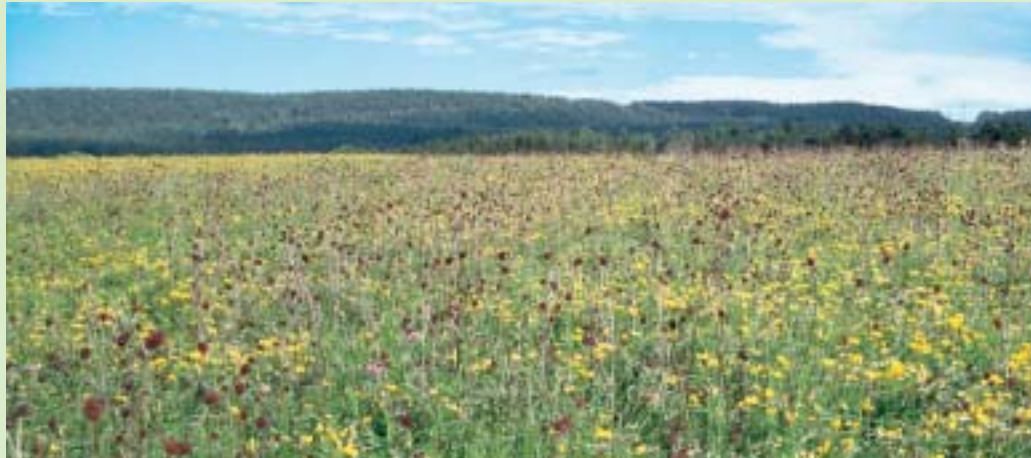
Hochsommeraspekt einer Zweischnittwiese mit Großem Wiesenknopf bei Ursensollen im Oberpfälzer Jura. Blütenreiche Heuwiesen sind heute bereits zur gesuchten Rarität geworden.

Positiv bewertet wurden naturnahe Flächen in der Feldflur, wie Hecken, Feldgehölze, Raine, Uferrandstreifen, Amphibienteiche, Streuobstwiesen, Einzelbäume oder stufig aufgebaute Waldsäume. Auch extensiv bewirtschaftete Wiesen mit spätem Schnittzeitpunkt, für die vertragliche Vereinbarungen nach dem Kulturlandschaftsprogramm oder dem Vertragsnaturschutzprogramm bestehen, erhielten einen Bonus. Für eine gute Vernetzung dieser Elemente untereinander sowie für kleine, schwierig zu bewirtschaftende Schläge, konnten die Teilnehmer Extrapunkte einheimsen.