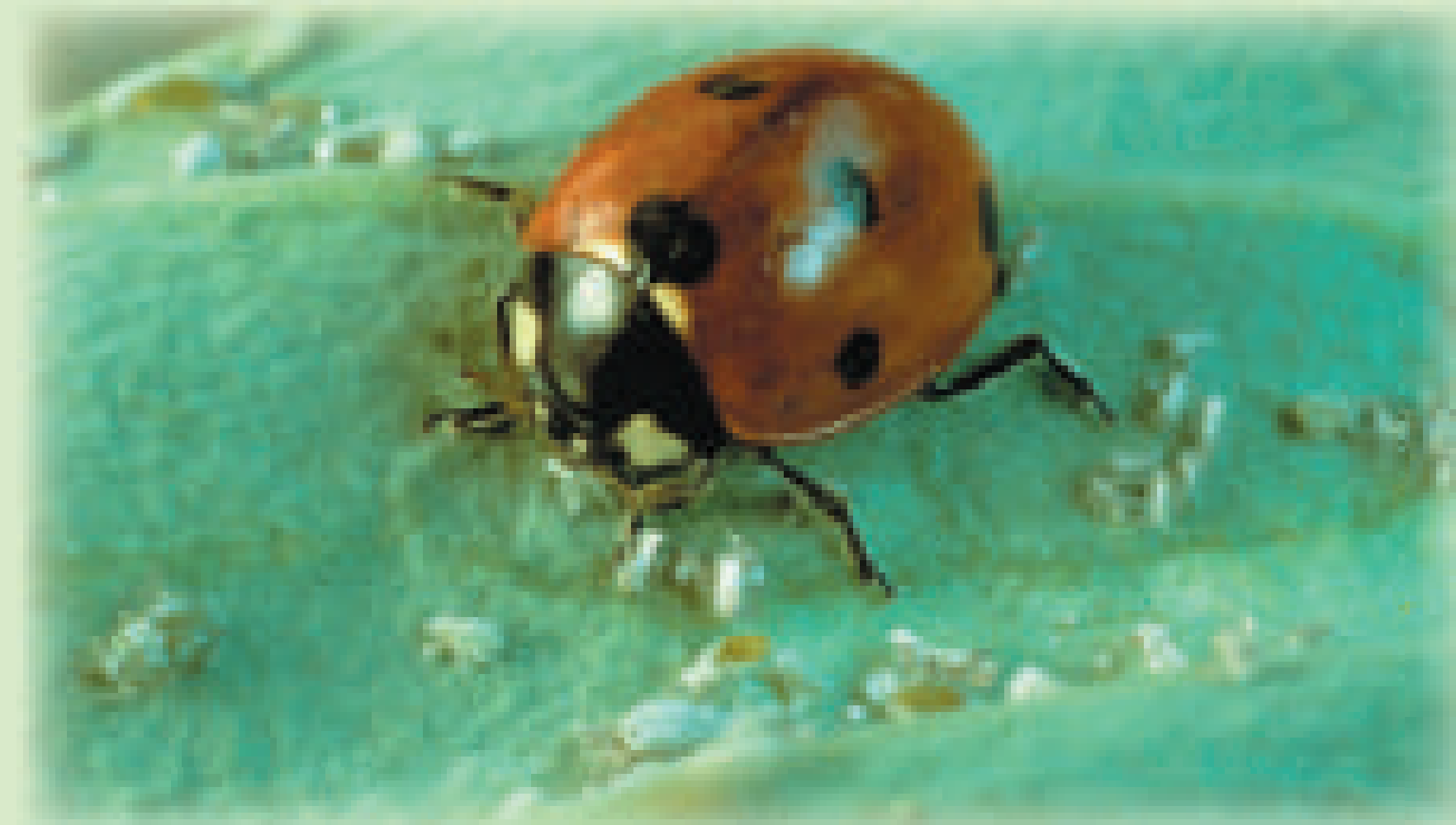
Marienkäfer: ein kostenloser Blattlausvertilger