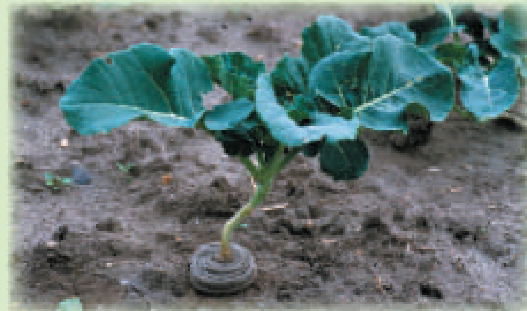
Biologischer Schutz vor Kohlflyen: die Kohlmanchette