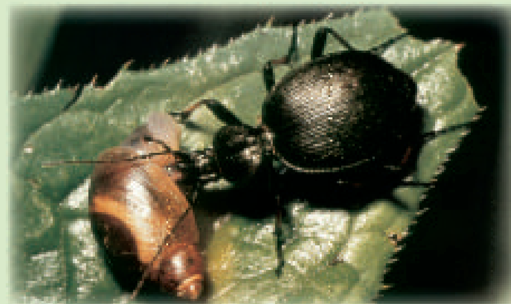
Schnecken haben viele natürliche Feinde, hier der Puppenräuber

Biologischer Pflanzenschutz = praktischer Bodenschutz!