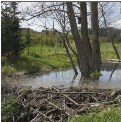
Abb. 3: Mit ihren Dämmen passen Biber den Wasserstand an ihre Bedürfnisse an.

Da Biber ihren Lebensraum aktiv gestalten, sind sie bei der Wahl eines Gewässers sehr flexibel. So besiedeln sie große Fließgewässer und Seen ebenso wie kleine Teiche, Bäche und Gräben. Aus kleinen Bächen lassen sie mitunter ganze Ketten von Biberseen entstehen.