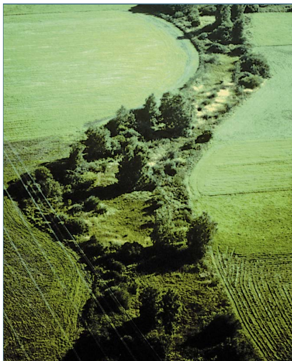
Abb. 19: Uferrandstreifen schaffen Abstand zwischen Biberrevier und Acker.

Eine wirksame und langfristig kostengünstige Maßnahme, um Probleme mit Bibern zu verringern, besteht darin, den Tieren ausreichend Lebensraum zu überlassen: In größeren Gewässern mit naturnahem Bewuchs fallen Biber kaum auf. Nimmt man Uferrandstreifen aus der Nutzung, bleibt den Bibern – und dem Gewässer – mehr Raum zur natürlichen Entwicklung.