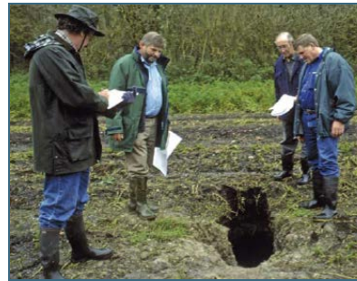
Abb. 15: Die meisten Konflikte mit Bibern lassen sich lösen.