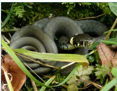
Abb. 10: Ringelnatter