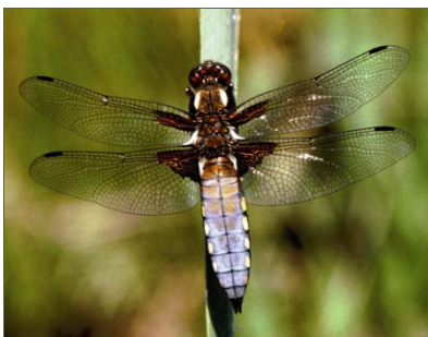
Abb. 7: Plattbauch-Libelle

Vom Menschen geschaffene oder umgestaltete Gewässer kennt die heimische Tier- und Pflanzenwelt dagegen erst seit wenigen hundert Jahren. Deshalb profitieren zahlreiche vom Aussterben bedrohte oder gefährdete Vögel, Amphibien und Libellen von der Wiedereinbürgerung des Bibers. Dies ist ganz im Sinne der Bayerischen Biodiversitäts-Strategie: Dort heißt es unter dem Stichwort „Handlungsschwerpunkte für die Zukunft“: „Fließgewässer sowie Seen und Weiher einschließlich der Ufer- und Verlandungszonen sollen dauerhaft eine naturraumtypische Vielfalt aufweisen und ihre Funktion als Lebensraum erfüllen.“