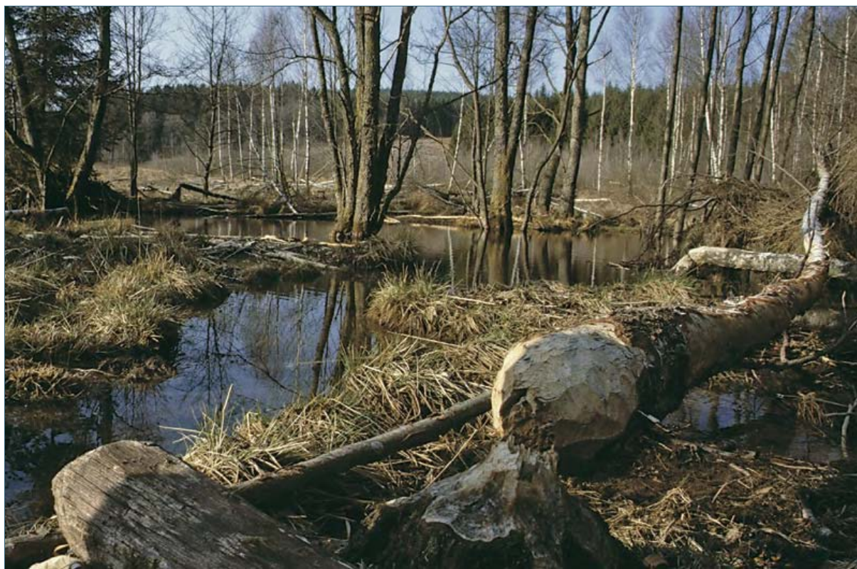
Abb. 13: Einst waren Biber in fast ganz Europa zuhause und haben die Landschaft geprägt. Heute, über 40 Jahre nach der Wiedereinbürgerung, besiedeln sie immer mehr Gewässer und verwandeln sie in ungewohnte Wildnis. Biber sowie ihre Baue und Dämme stehen unter strengem Naturschutz.

Nach dem Bundesnaturschutzgesetz ist der Biber streng geschützt. Das bedeutet, es ist verboten, ihm nachzustellen, ihn zu fangen, zu verletzen oder zu töten. Genauso ist es verboten, den Biber zu stören, seine Baue und Dämme zu beschädigen oder zu zerstören. Biber dürfen nicht verkauft oder gekauft werden, weder lebend noch tot oder ausgestopft.