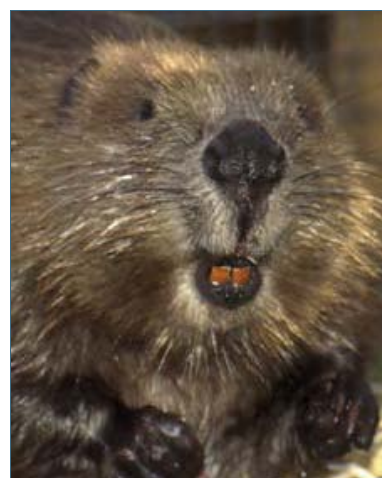
Abb. 2: Biber sind Nagetiere. Sie können über 30 kg schwer werden.