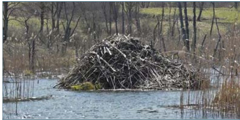
Abb. 4: Freistehende Burgen können über drei Meter hoch werden, ihr Eingang liegt stets unter Wasser.