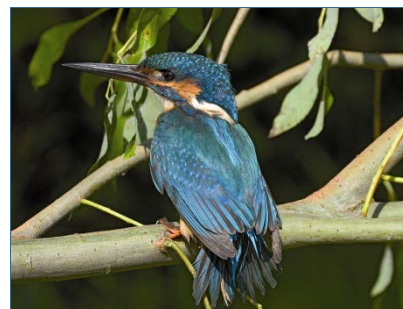
Abb. 9: Eisvogel