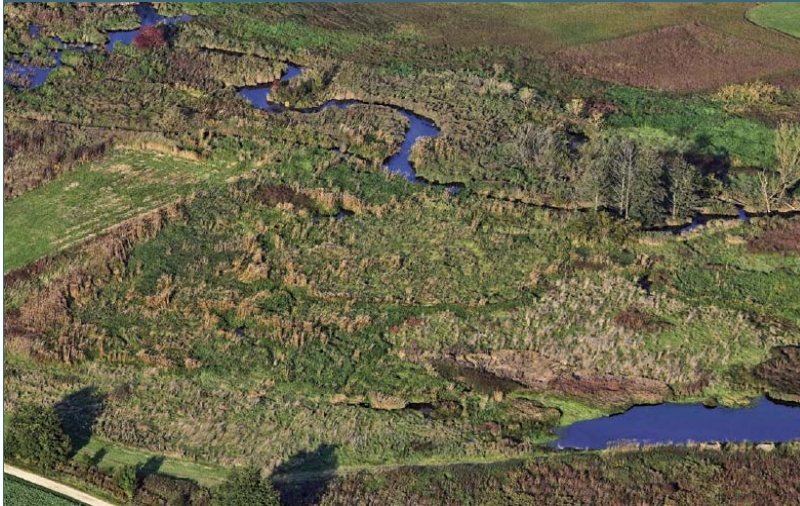
Abb. 6: Vom Biber gestaltete Landschaften sind ausgesprochen vielfäl- tig und artenreich.