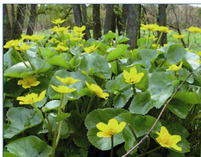
Abb. 11: Sumpfdotterblume