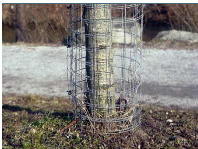
Abb. 16: Maschendraht schützt Bäume wirksam vor Verbiss.