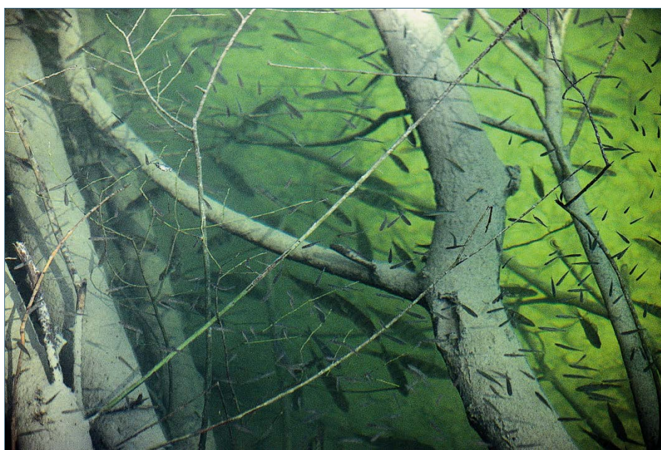
Abb. 5: Das vom Biber erzeugte Totholz schafft Jungfischen einen sicheren Unterstand.

Fällt ein Biber den Baum so, dass er ins Wasser stürzt, bietet das untergetauchte Geäst den Fischen gute Verstecke. Eine ähnliche Wirkung haben die Burgen, Dämme und Nahrungsflöße des Bibers. Im direkten Umfeld einer Biberburg findet man nach Untersuchungen des Landesfischereiverbandes Bayern Fischdichten, die bis zu 80-mal so hoch sind wie an vergleichbaren Gewässern ohne Biber. Der Grund: In Biberteichen finden Fische besonders viel Nahrung, sie vermehren sich gut und werden besonders groß; die Zahl der Laichplätze, Jungfisch-Einstände oder Winter-Ruheplätze steigt.