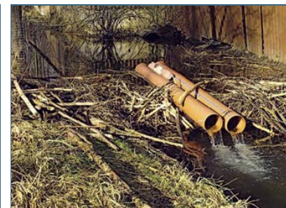
Abb. 18: Rohre im Biberdamm senken den Wasserspiegel.