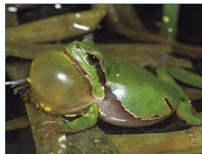
Abb. 12: Laubfrosch