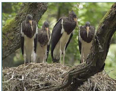
Abb. 8: Schwarzstörche