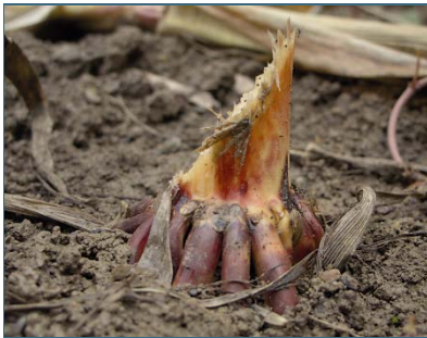
Abb. 14: Biber fressen auch Nutzpflanzen, z. B. Maisstängel.

Beratung und Öffentlichkeitsarbeit sind die Basis, um Konflikte mit dem Biber zu entschärfen oder zu lösen. Denn viele Konflikte mit Bibern entstehen oder verschärfen sich allein aus Unkenntnis über die Tiere und ihre Lebensweise: den Betroffenen sind viele der – oft erstaunlich einfachen – Möglichkeiten, einen Konflikt mit dem Biber zu beseitigen, nicht bekannt. Dabei reicht manchmal ein wenig Maschendraht. Bei Vorträgen und Exkursionen vermitteln die Biberfachleute wichtiges Wissen. Wer als Gartenbesitzer weiß, dass er seine Bäume ohne großen Aufwand schützen kann, steht dem Biber entspannter und positiver gegenüber.