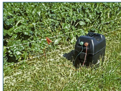
Abb. 17: Elektrozäune halten die lernfähigen Biber fern.