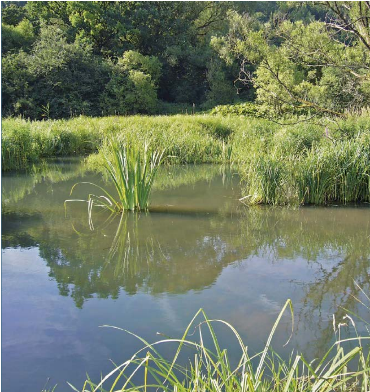
Abb. 20: Der Biber arbeitet für den Naturschutz, reguliert den Wasserhaushalt und schafft erholsame Landschaften für uns Menschen.

Biber haben sich vielerorts zu einem Qualitätsmerkmal für Erholungslandschaften entwickelt – sie locken sogar Urlauber an. In allen Teilen Europas sind in den vergangenen Jahren Biberlehrpfade angelegt worden. Exkursionen zu Biberrevieren sind sehr beliebt, die Teilnehmerzahlen zeugen vom großen Interesse an der Art. Bibertouren und -führungen können so zu einer neuen Einnahmequelle für den ländlichen Raum werden.