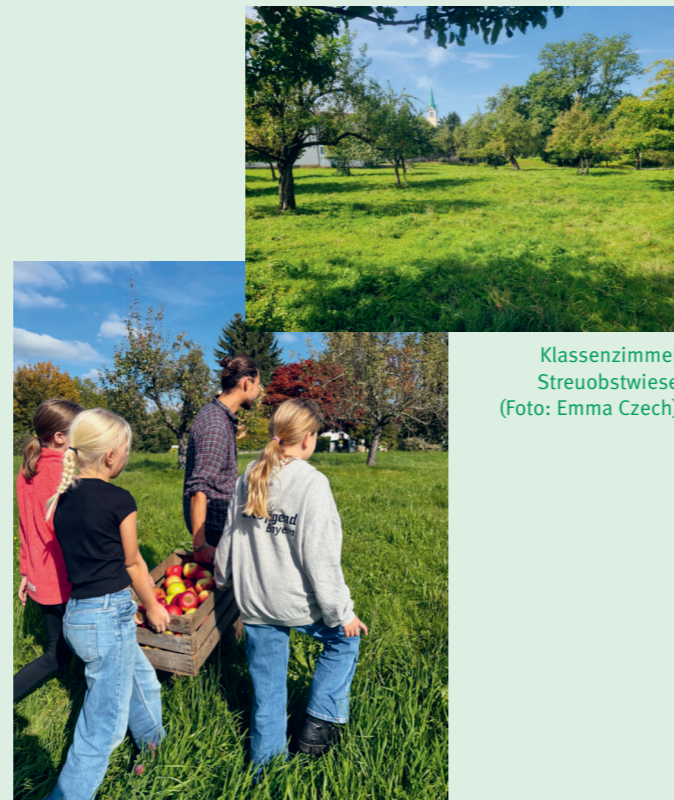
Klassenzimmer Streuobstwiese