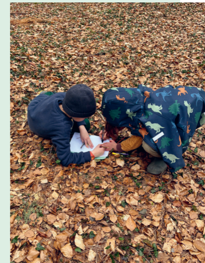
Entdeckungen im Laubwald

Um die Kapazitäten unserer Gruppen auszubauen, sind wir stets auf der Suche nach weiteren Betreuerinnen und Betreuern. Wenn du Interesse hast oder jemanden kennst, der sich eine Mitarbeit vorstellen kann, melde dich gerne beim BN Lindau.