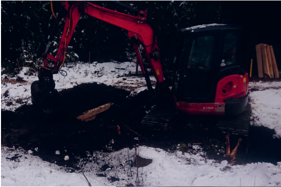
Baggern für den Klimaschutz

Das Jahr 2025 startete mit großer Ungewissheit. Aufgrund einer Haushaltssperre waren wichtige Fördermittel zur Umsetzung von Renaturierungsmaßnahmen oder zum Ankauf wertvoller Flächen zunächst nicht verfügbar. Nach langem Bangen, Nachhaken und Warten konnten schließlich doch alle Projekte, die die Kreisgruppe betreffen, durch den Landschaftspflegeverband (LPV) umgesetzt werden.