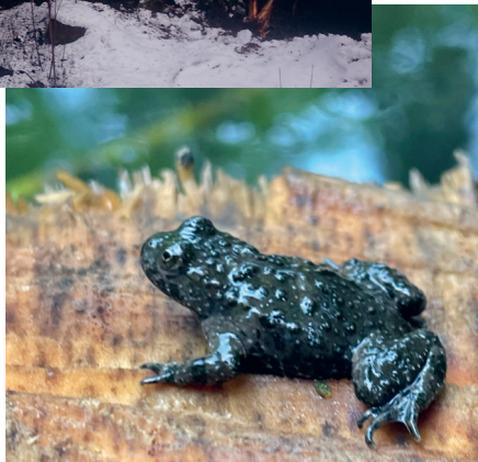
Eine Unke freut sich über ein neues Becken