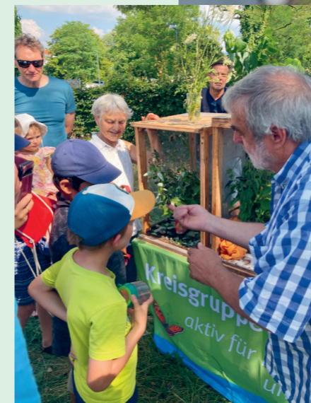
Faszinierende Schmetterlinge