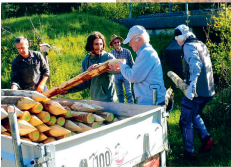
Neue Pfähle für einen Weg