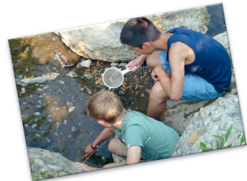
Bachflohkrebs entdecken

Knapp 600 Kinder und Jugendliche nahmen von Mai bis November 2025 an Umweltbildungsangeboten teil. In enger Kooperation mit dem Naturerlebniszentrum Biberhof (NEZ) bietet die Kreisgruppe Lindau maßgeschneiderte Programme für Kindertagesstätten und alle Schulformen an. Dabei engagieren sich sechs Umweltbildnerinnen. Interaktive Angebote wie »Geheimnisvolles Moor«, »Tiere und Pflanzen am Teich«, »Unterwegs im Wald« oder »Bachflohkrebs & Co« sorgten bei den Kindern und Jugendlichen für begeisterte Teilnahme. Umweltbildung umfasst viel mehr als Naturkunde. Alle können mitmachen, was Integration fördert. Soziale Kompetenzen wie Teamarbeit, Konfliktverhalten sowie Akzeptanz und Toleranz werden gestärkt. Exkursionen machen Natur erfahrbar. Die großzügige Spende des Rotary Clubs Lindau-Westallgäu unterstützt die wichtige Umweltbildungsarbeit der Kreisgruppe im Landkreis Lindau.