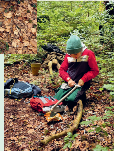
Schnitzen im Wald