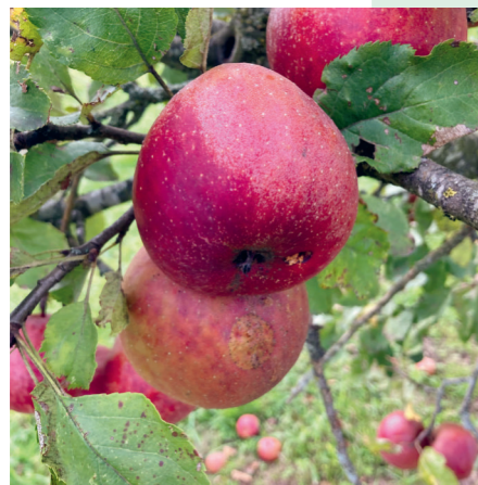
Apfel eines Streuobstbaumes

Streuobstwiesen haben es in sich und das kann man auch schmecken. Besonders in Form von frisch gepresstem Apfelsaft. Die Kindergruppe des BN Lindau hat das im Spätsommer zusammen mit Dominik Fiegler, der das Streuobstprojekt des BN leitet, erfahren dürfen. Zuerst ging es für die Gruppe auf Erkundungstour auf einer der traumhaften Streuobstwiesen in Lindau. Welche Bäume stehen hier? Wie unterscheiden sich Äpfel und Birnen? Welche Farben, Formen und Geschmacksvielfalt gibt es bei den Sorten? Diese und andere Fragen beantwortete Dominik. Nachdem die Kinder sorgfältig gekostet hatten, wuschen sie die zusammengestellte Mischung an Äpfeln, zerkleinerten diese in der Handmühle und beluden dann die Presse. Mit vereinten Kräften und vielen Runden im Kreis laufen floss den Teilnehmenden dann der goldgelbe und wohlschmeckende Apfelsaft entgegen. Mit dem Ergebnis waren alle sichtlich zufrieden und stellten bei der Trinkprobe im Schatten eines stolzen Birnenbaums fest, dass so eine Streuobstwiese ganz schön viel zu bieten hat.